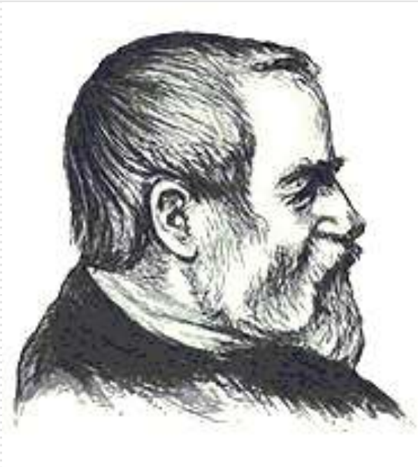
Французский поэт и революционер Эжен Потье

В XIX веке появился ещё один революционный гимн – пролетарский «Интернационал». Слова написал Эжен Потье, музыку – Пьер Дегейтер.