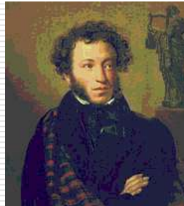
А.С. Пушкин. Художник О.А. Кипренский. 1827 г.