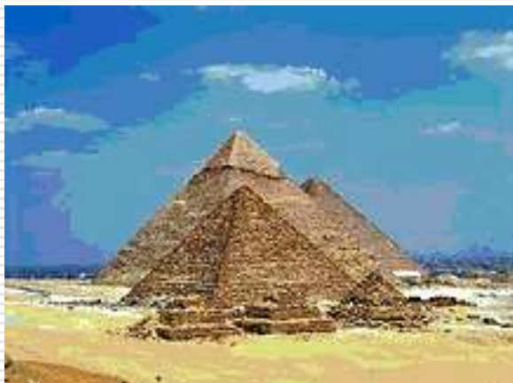
Пирамиды. Эль-Гиза. Древний Египет

Первые гимны были сложены в глубокой древности в Египте и Месопотамии, и возникли они гораздо раньше, чем гербы и флаги. Гимны представляли из себя молитвенные песнопения, прославляющие богов.