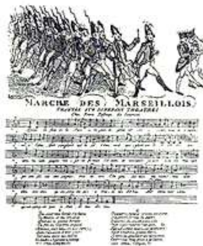
Нотный лист «Марсельезы» Руже де Лиля. 1792 г.