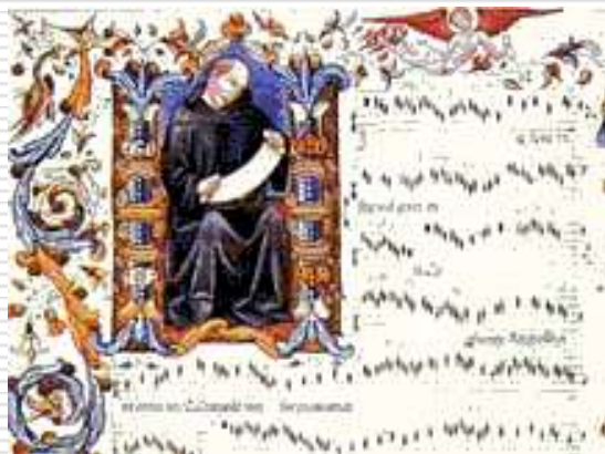
Манускрипт с записью гимна

Огромное влияние на все страны Восточной и Западной Европы оказали византийская культовая музыка, расцвет которой пришёлся на V – VI века. Религиозные движения в Европе в XI – XVI веках породили новые формы гимнов, не связанные с церковью. Стали создаваться торжественные песни, сопровождающие выходы государей.