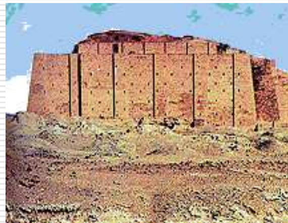
Город Ур. Месопотамия