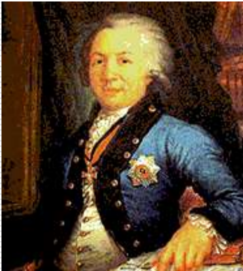
Г.Р. Державин. Художник В.Л.Боровиковский

В конце XVIII века появилось ещё одно произведение всероссийского значения – полонез «Гром победы, раздавайся!». Иногда его называли по припеву «Славься сим, Екатерина!». Стихи написал поэт Г.Р. Державин, музыку – О.А. Козловский.