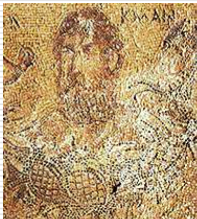
Древнегреческий поэт Алкман. Мозаика

В Древней Греции гимнами называли торжественные песни, прославляющие богов, героев, а также знаменательные исторические события. До наших дней сохранились творения многих известных поэтов древней Эллады: Алкман, Пиндара, Гомера. Пение гимнов во славу богов сохранилось и в христианстве. Так в Библию вошли гимны, встречающиеся в псалмах царя Давида.