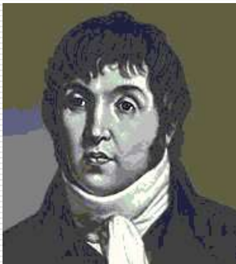
Клод Жозеф Руже де Лиль

Великая французская революция вдохновила инженера-капитана королевской армии Клода Жозефа Руже на написание в 1792 году революционного гимна «Марсельеза». В 1879 году «Марсельеза» была утверждена в качестве официального гимна Французской республики.