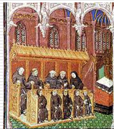
Монахи, поющие во время богослужения. Миниатюра. 1430г.