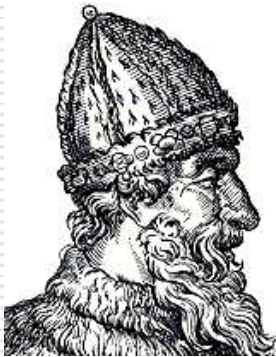
Иван III. Гравюра

В Древнюю Русь богослужебные песни-гимны пришли вместе с крещением в конце X века. Церковное песнопение развивалось всё время существования русской церкви. При московском князе Иване III был создан профессиональный хор «государевых певчих дьяков». Хор исполнял духовные песнопения гимнического характера не только во время церковных праздников, но и при всех событиях общегосударственной значимости.