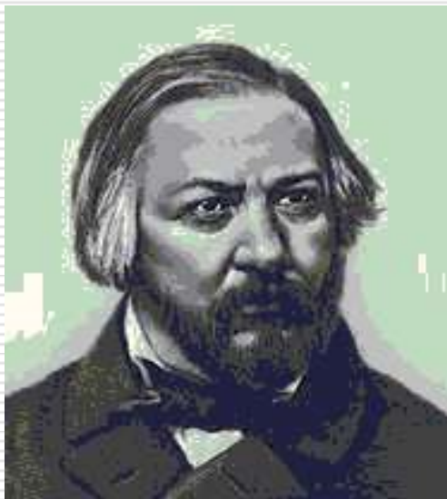
Русский композитор Михаил Глинка

После распада СССР в 1991 году гимном России стала «патриотическая песня» М.И. Глинки. После десятилетнего перерыва музыка А.В. Александрова вновь стала звучать как гимн, но не Советского Союза, а Российской Федерации. Слова нового текста написал С.В. Михалков.