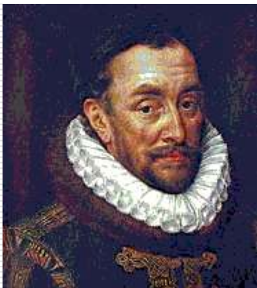
Принц Вильгельм Оранский. Портрет работы А. Кея

Первый национальный гимн появился в Голландии в 1568 году. Это была песня в честь Вильгельма Оранского, возглавившего борьбу против испанского владычества.