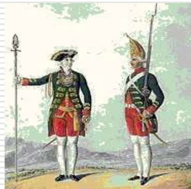
Офицер и гренадёр лейб-гвардии Преображенского полка. Литография. 1762 г.