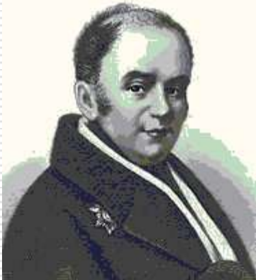
Русский поэт Василий Жуковский

Интересна история создания текста гимна. В 1815 году поэт В.А. Жуковский написал и опубликовал в журнале «Сын Отечества» стихотворение «Молитва русских», посвящённое императору Александру I. В 1816 году А.С. Пушкин приписал к стихотворению ещё две строфы. В 1833 году Жуковский по просьбе Львова дополнил и закончил своё стихотворение.