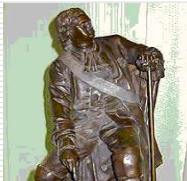
Петр I. Скульптурный портрет А.М. Опекушина. 1762 г.

В эпоху Петра Первого появилось много песнопений, прославляющих царя и «молодую Россию». Каждый полк имел свой оркестр и свой марш. Наибольшую известность получил Преображенский марш Петра Великого, появившейся в Преображенском полку. Преображенский марш являлся главным маршем России до конца 1917 года. В годы Гражданской войны Белое движение использовало его в значении русского гимна.