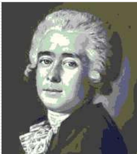
Д.С. Бортнянский. Художник М.И. Бельский. 1788 г.

Одновременно со светским гимном «Гром победы» появился духовный гимн, дошедший до наших дней, - это «Коль славен наш Господь в Сионе». Музыку духовного гимна написал замечательный русский композитор Д.С. Бортнянский, слова – М.М. Херасков.